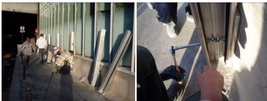
8h00 - Fin de montage des poteaux - Début de mise en place des batardeaux (ou poutres)