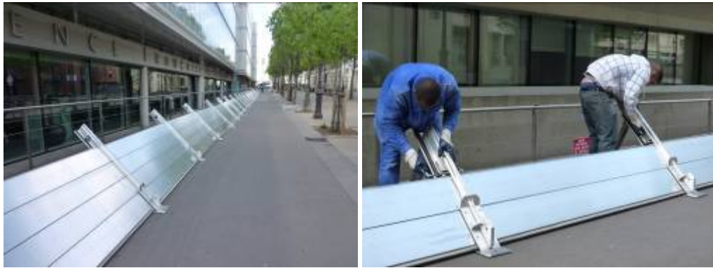
12h00 - Début de montage de la protection sur la pointe du bâtiment