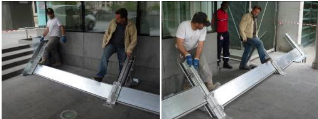
12h30 - Fin de montage