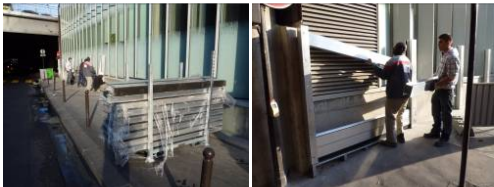
8h45 - Fin de mise en place des batardeaux - Début de mise en place de la ligne de protection inclinée sur la rue de Rambouillet