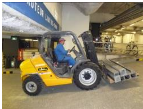
7h15 - Montage des poteaux verticaux sur la rue de Rambouillet