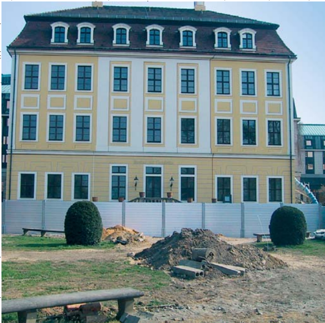
Vue des jardins pittoresques de la rivière de l'Elbe, les «Elbwiesen», sur l'hôtel Bellevue.