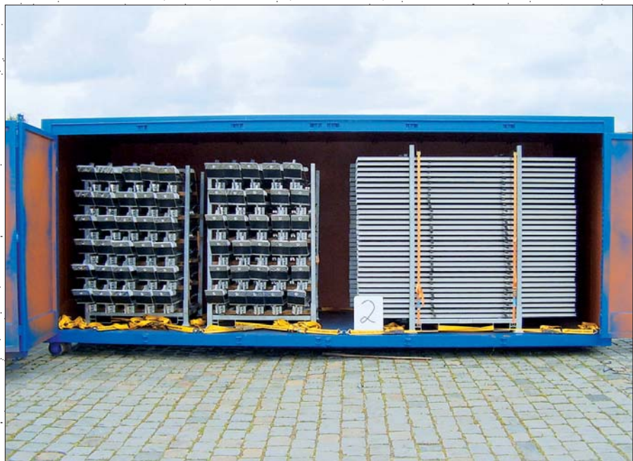
Conteneur avec portes, s'ouvrant sur les côtés, ouvertes.

Le transfert de charge vers le sol ainsi que les caractéristiques de la voirie ont été fournis par la ville de Ratisbonne. Il était de la responsabilité du fabricant d'assurer le raccord entre les supports existants et le K-System. Trois situations de fixation ont été déterminées : premièrement, l'ancrage des