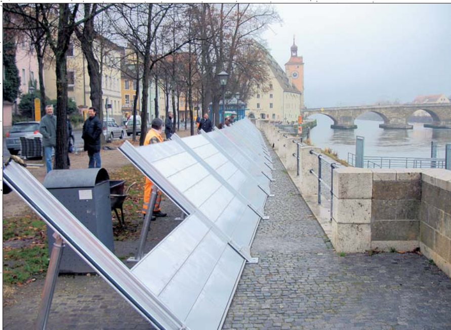
Le K-System d'IBS sur la promenade historique du Danube à Ratisbonne.

En raison du matériel employé et de sa qualité supérieure et de l'utilisation depuis de nombreuses années dans le cadre de la protection anti-crue, la durée de vie du système IBS est illimitée lorsque le stockage est réalisé correctement. Le dispositif est utilisable autant de fois que nécessaire sans que des pièces détachées de remplacement soient obligatoires.