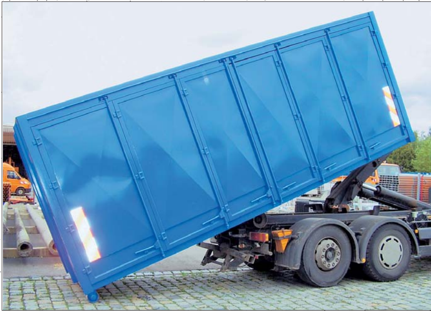
Conteneur de transport sur le crochet d'un camion lors du chargement.

permis. Suite à une utilisation lors d'une crue, le système devait être parfaitement réutilisable.