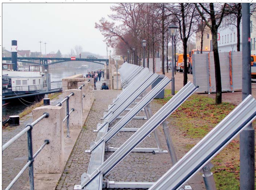
IBS-System im Aufbauzustand K-Böcke und erster Dammbalken mit Bodendichtung

Les composants requis pour l'installation du K-System dans son intégralité sont déjà complets lors de la livraison du système et sont, de ce fait, disponibles en permanence. Un simple véhicule de levage comme p. ex. un tracteur ou un petit chargeur sur roues à pelle peut être utilisé pour le montage. Il est également possible, si besoin est, de transporter les composants du système par chariot élévateur ou de les distribuer manuellement de manière individuelle sur le lieu de l'intervention. En fonction de la hauteur de protection, quatre à huit personnes nécessitent une heure afin d'ériger un mur protecteur de