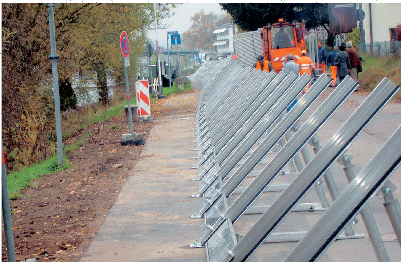
Le système IBS en cours d'installation – poteaux obliques et première poutre avec joint de sol.

Le linéaire de panneaux devait pouvoir former des angles à 90 degrés. Un rayon de courbure minimum de