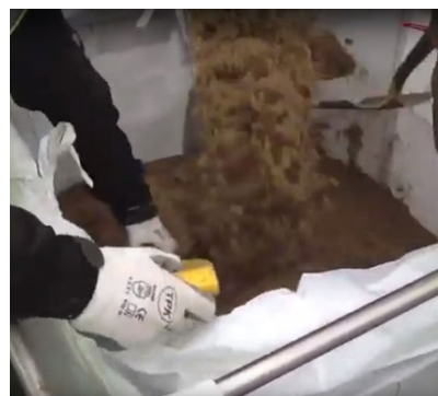
Gabarit de remplissage